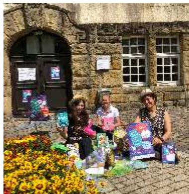
Alizadeh / Privat

Montag geschlossen Dienstag, Mittwoch, Freitag 10.00 – 17.00 Uhr Donnerstag 14.00 – 18.30 Uhr