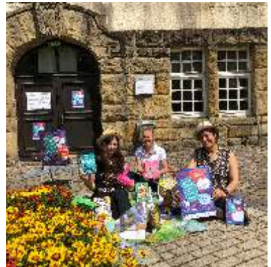
Alizadeh / Privat

Montag geschlossen Dienstag, Mittwoch, Freitag 10.00 – 17.00 Uhr Donnerstag 14.00 – 18.30 Uhr